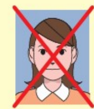
顔写真は不要です